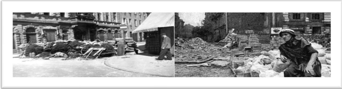
4 - As barricadas espalham-se pela cidade.

do rio. A intenção de Stalin era claramente esperar para ver, deixando o inimigo alemão e o Armia Krajowa desgastarem-se antes de avançar.