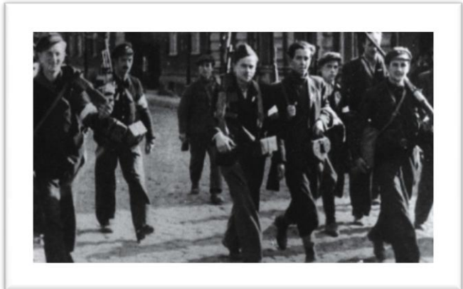
2 - Armia Krajowa invade as ruas nos primeiros momentos da revolta.

Reunindo-se rapidamente com as poucas armas disponíveis em Varsóvia, espalharam-se pela cidade mesmo antes da hora marcada para o início da revolta, ansiosos por terminar os cinco anos de cruel ocupação. Perdeu-se assim grande parte do efeito surpresa necessário para capturar todos os pontos nevrálgicos da cidade.