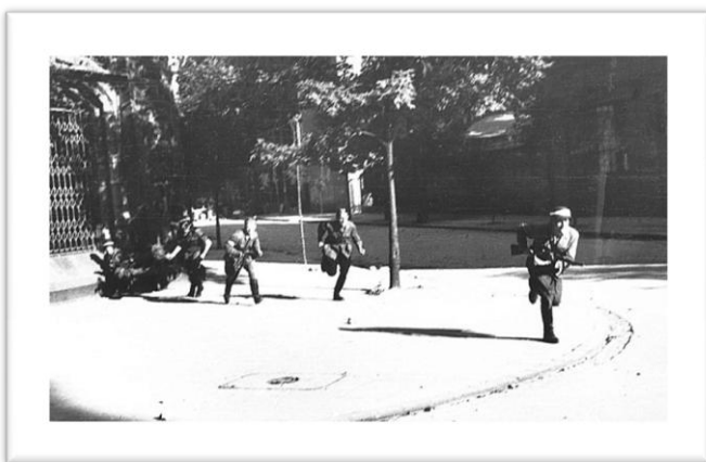
3 - Ataque a uma guarnição alemã.

Mal equipados em termos de armamento e mesmo em fardamento, em poucos dias se percebeu que as milícias do Armia Krajowa não conseguiam desalojar as tropas alemãs dos pontos reforçados em que os cercavam. À medida que o confronto evoluiu conseguiram encontrar um escape mais produtivo para o seu empenho na defesa das barricadas que cortaram as vias de comunicação e marcaram os pontos de resistência ao longo da cidade.