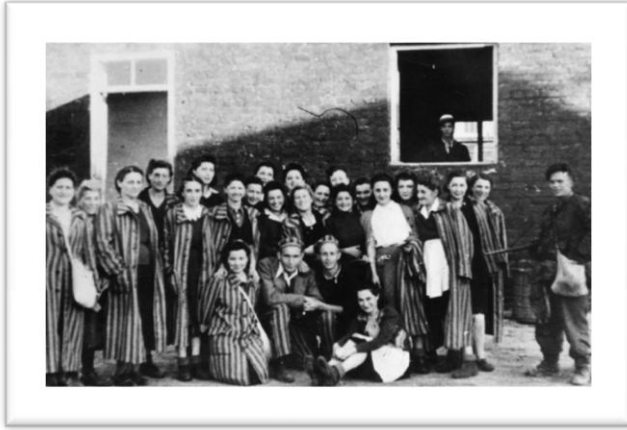
7 - Libertação de Gesiowka.

Tirando alguns parques milhares dispersos por esconderijos na cidade, estes 348 prisioneiros eram tudo o que restava dos 400 mil judeus que viviam em Varsóvia (um terço da população total da cidade) antes de Setembro de 1939.