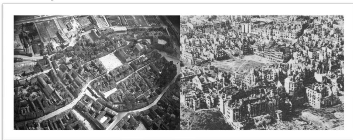
11 - A praça do mercado do bairro da cidade velha, antes e depois da revolta.

Quando finalmente o exército soviético forçou a entrada na cidade em 17 de Janeiro de 1945, com o Ludowe Wojsko Polskie à frente, 85% da cidade estava irreparavelmente em ruínas.