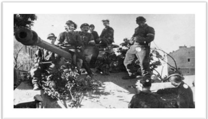
6 - O Panther "Magda" momentos antes do ataque.

No início da tarde desse dia o Kapitan Waclaw "Wacek" Micuta e a terceira companhia do batalhão Zoska, atacaram o campo prisional Gesiówka, situado no antigo ghetto judeu.