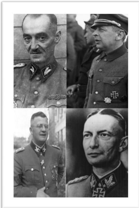
5 – Da esquerda para a direita, em cima: Dirlewanger e Kaminski e em baixo: Bach e Reinefarth.

"Isto é o nosso maior problema. Estes refugiados! Não tenho munição para os matar todos já aqui!" - Reinefarth