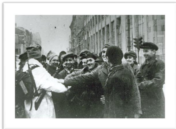
8 - Soldados do Ludowe Wojsko Polskie recebidos em extase pelo Armia Krajowa.

Sem apoio externo, sem capacidade de tomar a iniciativa, os polacos rapidamente se aperceberam do seu destino. Já sem grande esperança nos desesperados pedidos de intervenção e auxílio externo, foram vendendo cada barricada, cada rua, o mais caro possível.