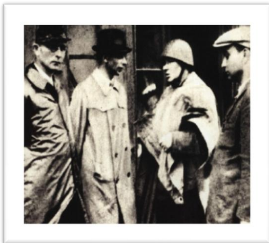
1 - Bor, segundo a contar da esquerda, durante a revolta.

Enquanto as tropas polacas no exílio lutavam em todas as três frentes europeias tornou-se claro que seria preciso uma revolta na Polónia para garantir que o futuro estado polaco ficaria fora do controle soviético.